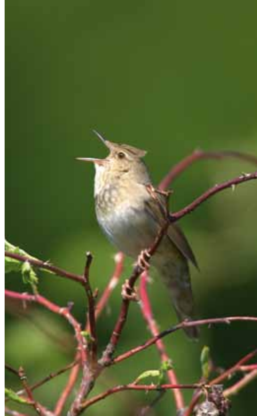
Flodsångare ( Locustella fluviatilis ). Tiden får utvisa om senaste säsongernas högre noteringar är del av en långsiktigare trend.

Som antyds ovan så finns det alltså inget helt säkert svar på frågan om vilka arter vi kommer att kunna följa. Hos vanliga och välspredda arter kommer man att under en given tidsperiod kunna fånga upp förhållandevis små förändringar, hos mer ovanliga arter kommer det under motsvarande tidsperioder att krävas större populationsförändringar för att några trender skall kunna bekräftas av de statistiska beräkningarna. Man måste också tänka på att vissa arter kommer att bibehålla