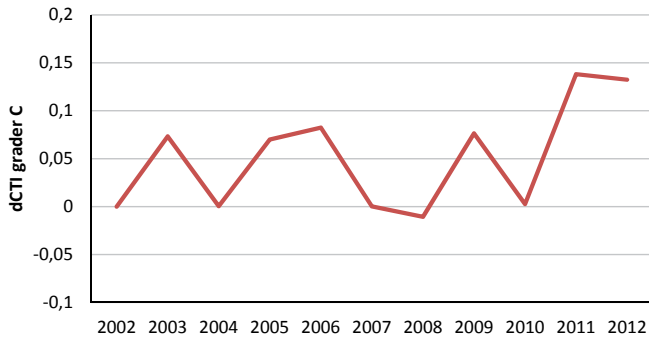
Figur 6. Begränsad klimatpåverkan 2002–2012

CTI har ökat statistiskt signifikant i C-län 2002–2012 ( r^2=0,33 , p < 0,05 ) I figuren visas förändring i CTI (dCTI). 2012 var CTI 0,13 grader högre än 2002.