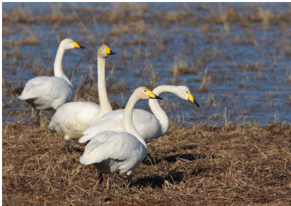
Sångsvanen ( Cygnus cygnus ) har ökat kraftigt i landskapet under den senaste 11-årsperioden.