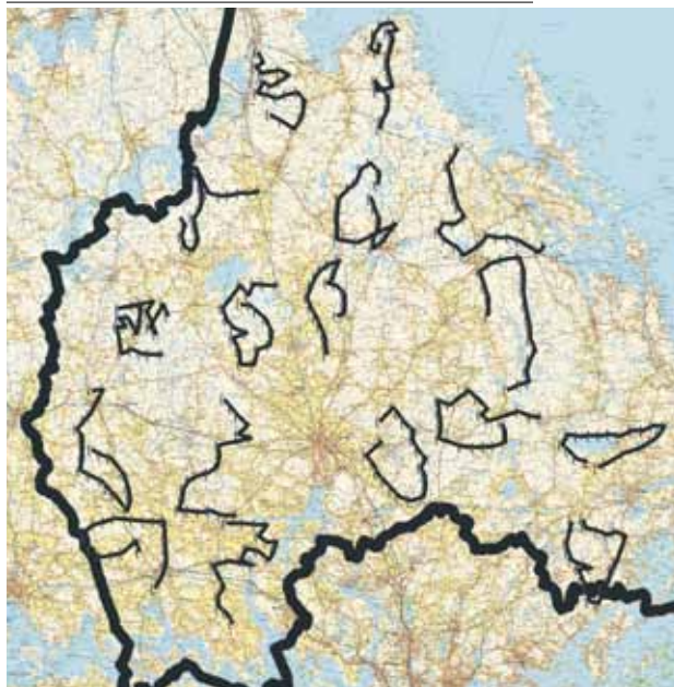
Figur 7. Karta över rapportområdets 17 nattrutter (15 i Uppsala län och 2 längst i öster i Stockholms län).

Upplägget av denna nattfågeltaxering kräver biltransport och det har därför inte varit möjligt att staka ut sträckorna lika randomiserat som standardrutterna. Ett krav har ändå varit att hålla sig inom motsvarande gamla topografiska kartblad på 25x25 km. En nattrutt består av 20 avlyssningspunkter med minst två km mellanrum utefter en ca 50 km lång sträcka längs icke bommade och i vinterväglag farbara vägar. Stopp görs under exakt fem min för att lyssna efter revirhävande fåglar. Våra nattaktiva arter skiljer sig påtagligt sinsemellan, när under våren de är som mest aktiva att hävda revir, med flera ugglor som tystnar redan i april samtidigt som många tropikflytande fåglar kan dröja ända in i juni innan