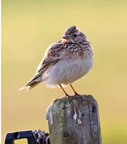
Sånglärkan ( Alauda arvensis ) är en av indikatorarterna i miljömålet Ett rikt odlingslandskap.

Av fåglar som häckar i Uppsala län är det inventeringsdata för 13 arter som används som indikatorer för detta miljömål. Samtliga minskade mer eller mindre kraftigt i slutet av 1900-talet, mest som en följd av de stora förändringar som då ägde rum inom jordbruket. För många av dem har den negativa trenden planat ut och bestånden är numera relativt stabila eller nedgången inte lika omfattande som tidigare. Resultatet från standardrutterna 2002–2012 uppvisar inte någon statistiskt säkerställd förändring för dessa arter på grupp-nivå och det är i linje med hur det förhåller