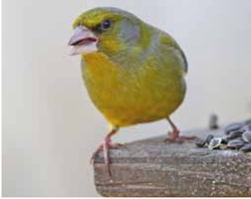
Grönfinkens ( Carduelis chloris ) nedgång märks tydligt i resultaten från standardrutterna.