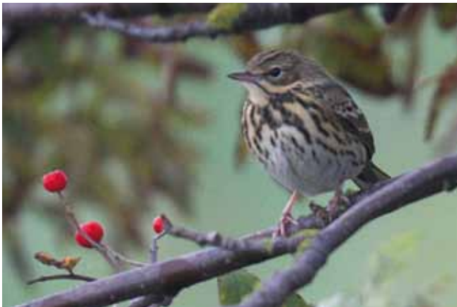
Trädpiplärkan ( Anthus trivialis) ligger på topp 10-listan bland de vanligaste arterna på standardrutterna.